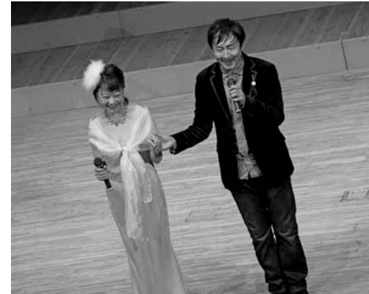
2019年3月の県民芸術劇場より<アピカホール>