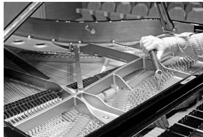
約230本の弦の音合わせ