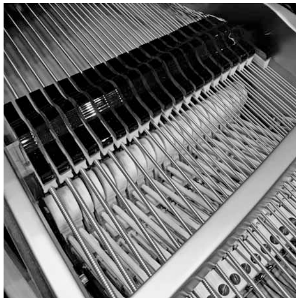
鋼でできた弦を羊の毛で作られたハンマーでたたいて音を出す