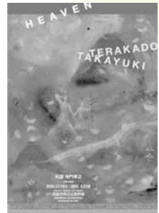
第20回企画展「天国:寺門孝之」展ポスター

画家、イラストレーターとして多彩な活動を展開する寺門孝之の天使画の代表作や新作絵画を展示し、その魅力に迫ります。