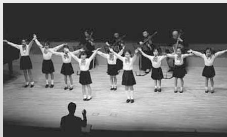
2016年2月28日(日)コンサートより

現在は、小学1年生から中学1年生までの8名が在籍し、5回目のコンサートに向け、元気に楽しく練習を頑張っています。