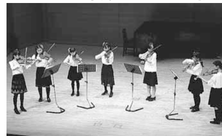
2016年3月27日(日)コンサートより