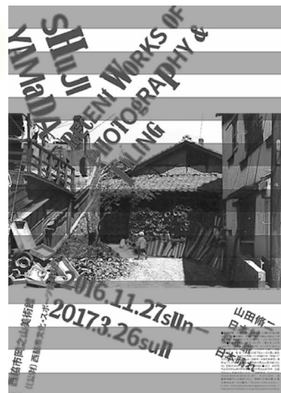
「山田脩二-日本村・日本旅・日本晴れ-」展ポスター