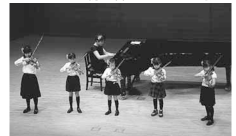
2016年3月27日(日)コンサートより