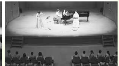
幼稚園お出かけコンサート