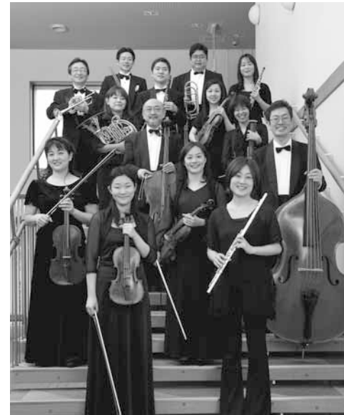
★特定非営利活動法人(NPO)京都フィルハーモニー室内合奏団★