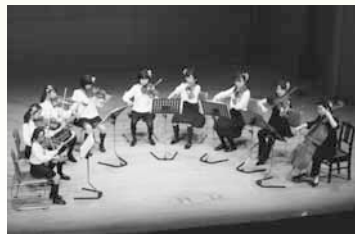
弦楽アンサンブル教室 2014