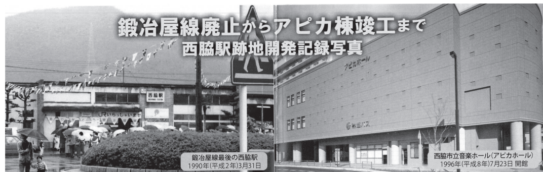
鍛冶屋線最後の西脇駅 1990年(平成2年)3月31日

180席という小規模なホールでありながら、音響的に優れた構造と「スタインウェイ D-274」を完備した環境は、国内外のプロの演奏家からも高く評価されてきました。ここで生まれた数えきれないほどの笑顔や拍手が、この建物の壁や床、天井に染み込み、当ホール独特の温かみを作り上げています。