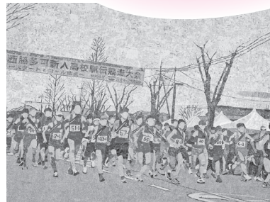
岡本和喜(駅伝スタート)2025年 作家蔵

奇抜さとユーモラスな表現で注目をあびる美術家岡本和喜。現代の食品包装ラベルを用いて再構成した「浮世絵」シリーズの代表作や、駅伝を取材した新作などを紹介し、その魅力に迫ります。