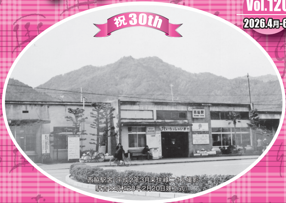
西脇駅舎 (平成2年3月 駅舎は昭和28年2月20日竣工式)