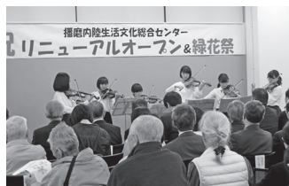
2019年3月30日 播磨内陸生活文化総合センター リニューアルオープン&緑花祭出演