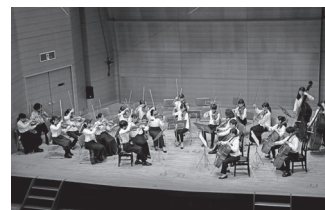
2019年5月1日 第141回しばざくらコンサート さくらジュニアオーケストラと共演