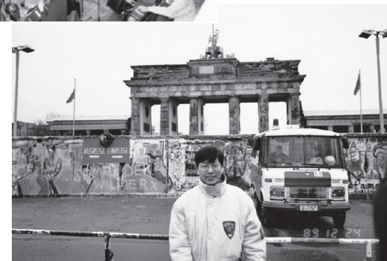
ブランデンブルク門の壁の前で