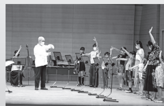
毎年恒例の ヴァイオリンワークショップ風景