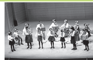
2016年3月27日 第4回コンサート