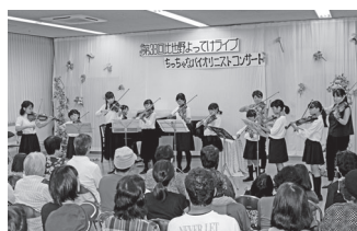
2018年9月1日 比也野よってけライブ