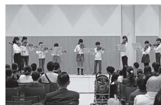
2018年10月28日 みらフェス出演