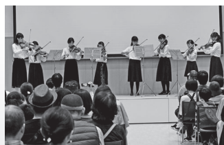
2019年10月27日 みらフェス出演