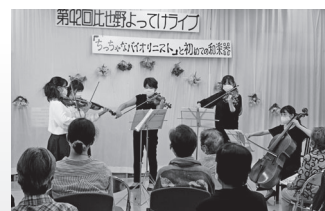
2020年9月26日 比也野よってけライブ