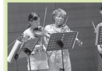
2019年7月21日 世界的ヴァイオリニスト 堀米ゆず子さんレッスン風景