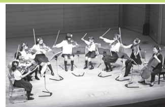
2015年3月29日 第3回コンサート