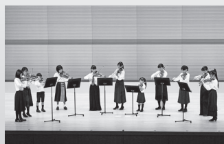
2021年12月19日 子ども芸術祭、子どもステージ