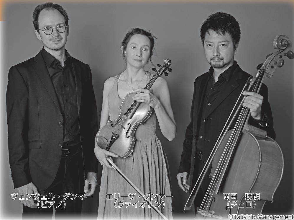
ヴェンツェル・ゲンマー (ピアノ)