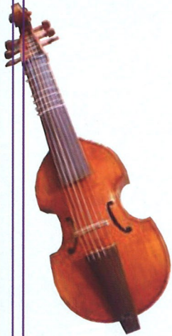
ヴィオラ・ダ・ガンバ

この度、西脇市岡之山美術館は古楽器製作家 平山照秋の展覧会を開催します。平山照秋（1949年神戸市生まれ）は、篠山市を拠点に中世から前古典時代の楽器を製作する古楽器製作家です。20歳の頃に趣味で楽器演奏を始めて以降、バロック期の作曲家が活躍した時代の楽器を製作したいという思いから25歳で初めてヴィオラ・ダ・ガンバを製作します。チェンバロ、リュート等の古楽器製作をする傍ら、天草コレジオ館や大阪音楽大学附属音楽博物館等の依頼でヴァージナル、フィーデル、レベック、ハープ、スピネット等の楽器の復元製作も手がけています。本展では、平山が製作したチェンバロ、ヴィオラ・ダ・ガンバ、リュート等の古楽器を展示、解説、演奏し、美しい音色を奏でる古楽器の魅力に迫ります。